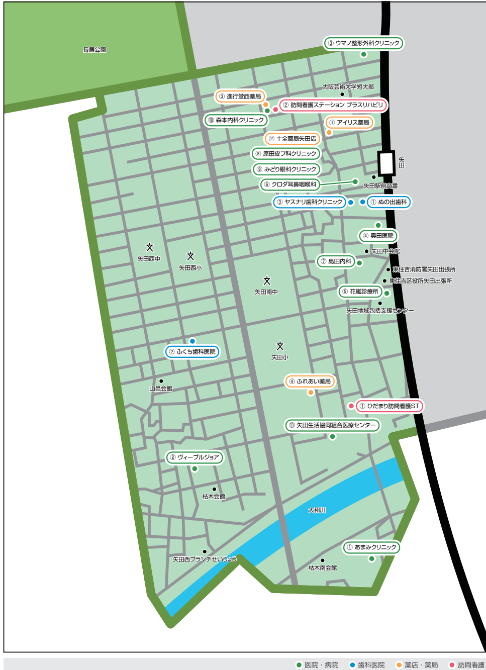
● 医院・病院 ● 歯科医院 ● 薬店・薬局 ● 訪問看護